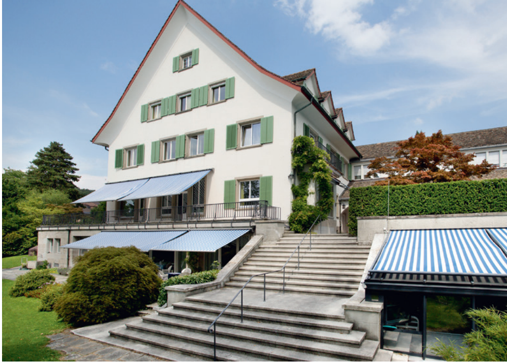
In neuem Glanz präsentiert sich die Klinik Susenberg nach einer sanften Renovation.

dienst unseres engagierten Personals», freut sich die Leitende Ärztin.